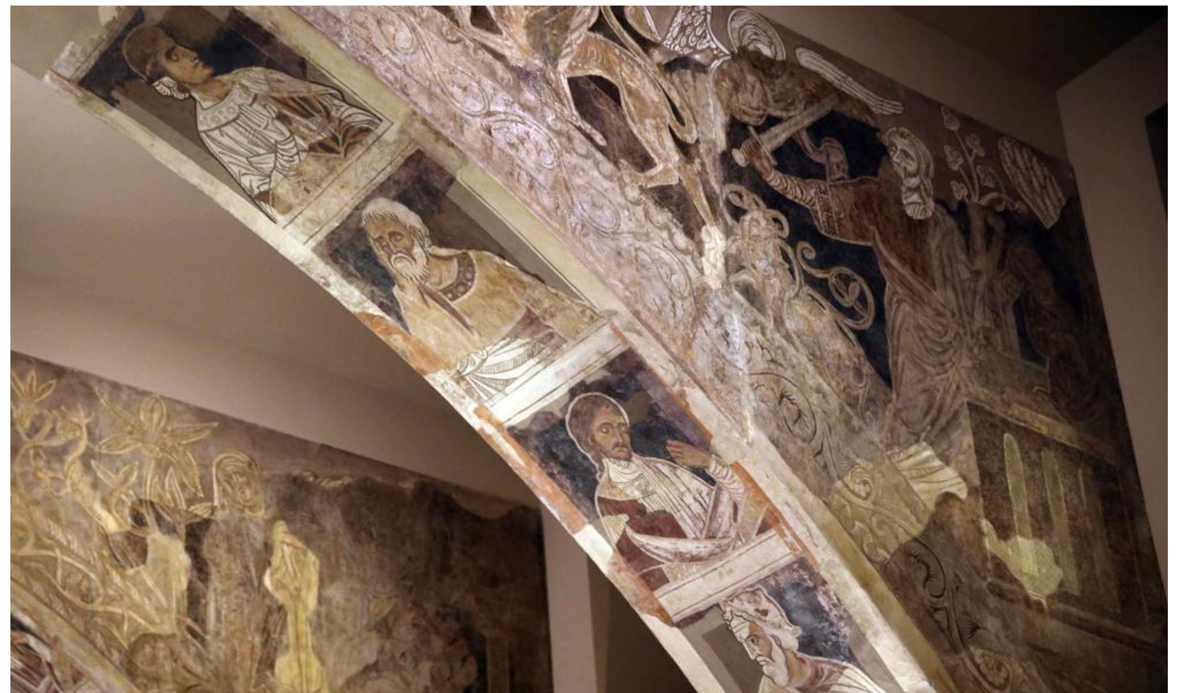
Abbildung 4: Wandmalereien des Klosters Sijena (Spanien) im MNAC