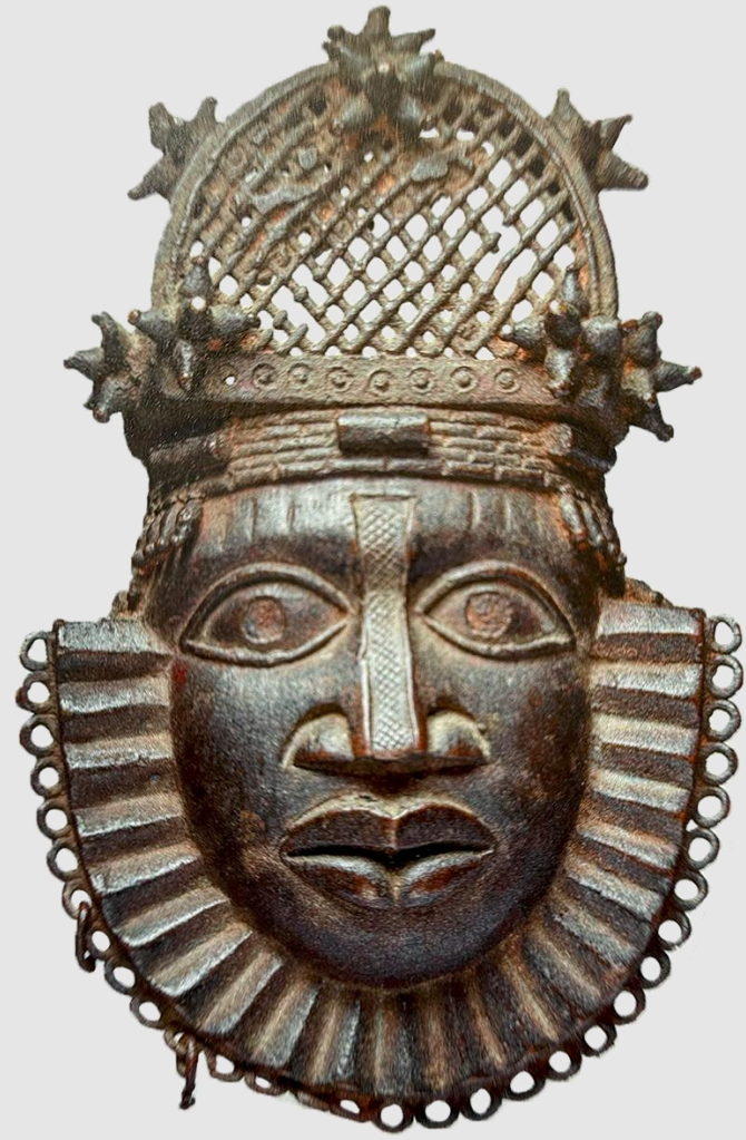
Abbildung 1: Benin-Bronze aus Benin (Nigeria) im Museum Rietberg

Geklaut, geplündert, entwendet; viele Kulturgüter in europäischen Museen haben eine unklare oder mit Gewalt und Unrecht verbundene Vergangenheit. Sie gelangten durch Diebstähle, Plünderungen und Kriege in die Museen. Es stellt sich hierbei die Frage der Restitution und Rückgabe. Als Restitution wird im Kontext der Kulturgüter die Wiederherstellung des Eigentumsrechts an die ursprünglichen Eigentümer der Werke bezeichnet. Die Rückgabe bezeichnet hingegen die Übertragung des Besitzes an die ursprünglichen Eigentümer. Die zentrale Fragestellung lautet: Müssen im Rahmen der Restitutionsdebatten die Benin-Bronzen im Museum Rietberg in Zürich, die Parthenon-Objekte "Elgin-Marbles" im British Museum in London und die Gemälde des Klosters Sijena im Museu Nacional d'Art de Catalunya (MNAC) in Barcelona, die unter nicht vollständig geklärten Umständen ihren Eigentümern entwendet wurden, restituiert und zurückgegeben werden? Ziel dieser Arbeit ist es somit anhand von drei konkreten Fallbeispielen zu beurteilen, ob in diesen aktuellen Restitutionsdebatten eine Restitution erfolgen muss und inwiefern sich diese Fälle voneinander unterscheiden.