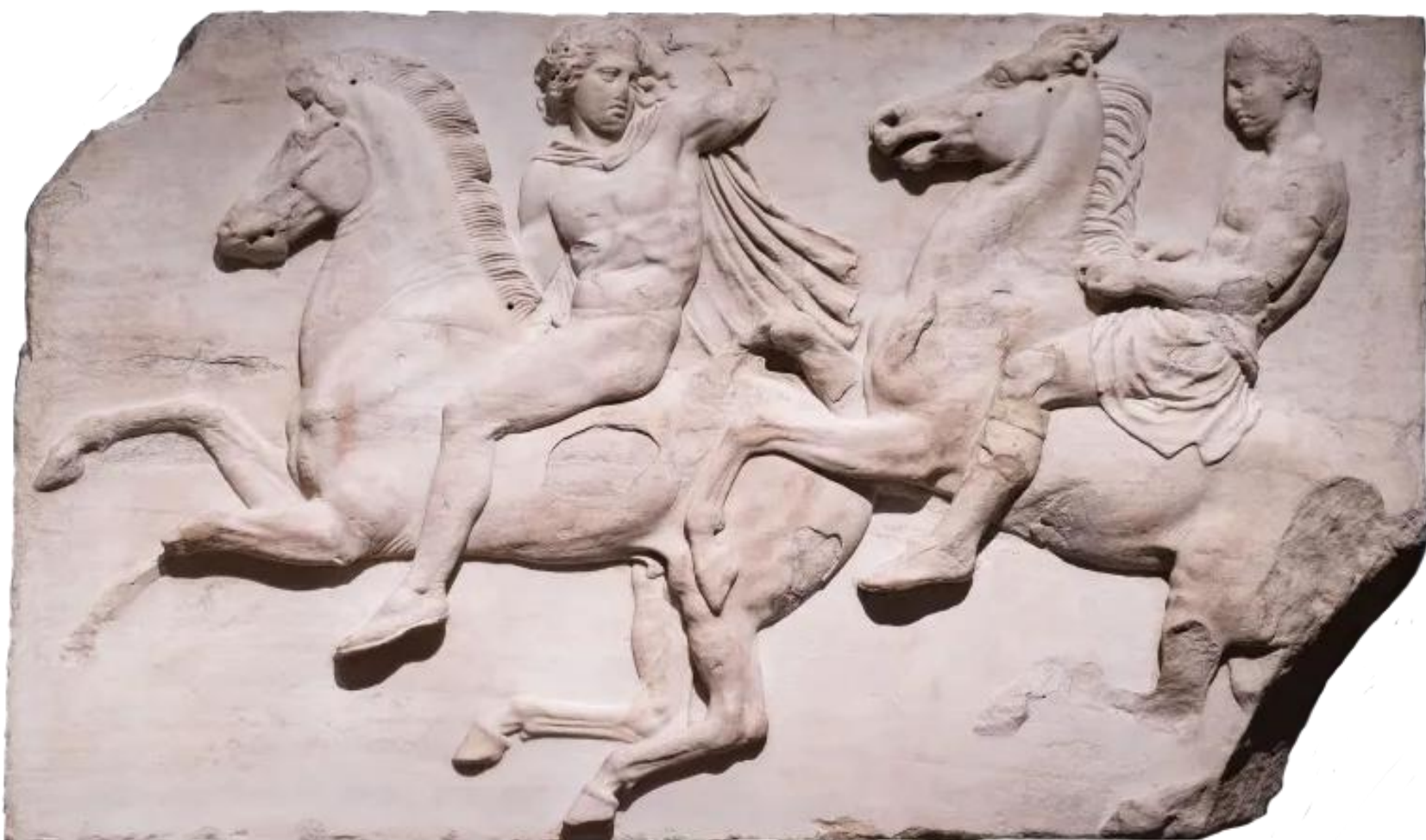
Abbildung 2: Fries des Parthenons (Griechenland) im British Museum